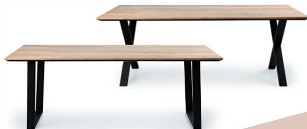
Eettafel U-poot of X-poot 160x90xH77 190x90xH77 190x90xH77 220x100xH77 240x100xH77 250x100xH77

Onderhoudsadvies: U kunt lamulux vergelijken met de toplaag van een goede laminaat vloer. Het heeft verder geen onderhoud nodig, enkel regelmatig afnemen met een droge katoenen doek en vlekken verwijderen met een licht vochtige katoenen doek volstaat. Wel altijd even nadrogen met een schone katoenen vaatdoek. Hardnekkige vlekken kunnen verwijderd worden met Multi Cleaner welke bij ons verkrijgbaar is.